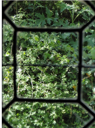
Fenster des Suso-Hauses